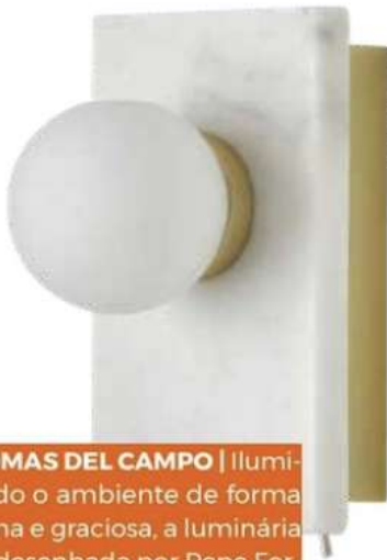
AROMAS DEL CAMPO | Iluminando o ambiente de forma íntima e graciosa, a luminária Lan desenhada por Pepe Fornas traz elegância. Personalizada em mármore, está disponível nas cores branca e preta, conferindo modernidade ao espaço