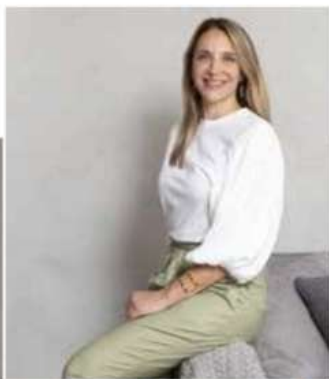
ANA TOSCANO ARQUITETURA @anatoscanoarquitetura

UMA SELEÇÃO DE PROJETOS E AMBIENTES NOS MAIS DIVERSOS ESTILOS, EM DIFERENTES COMPOSIÇÕES E VOLTADOS PARA AS NECESSIDADES DOS MORADORES. DESCUBRA ESPAÇOS PARA INSPIRAR O DÉCOR DA SUA CASA!