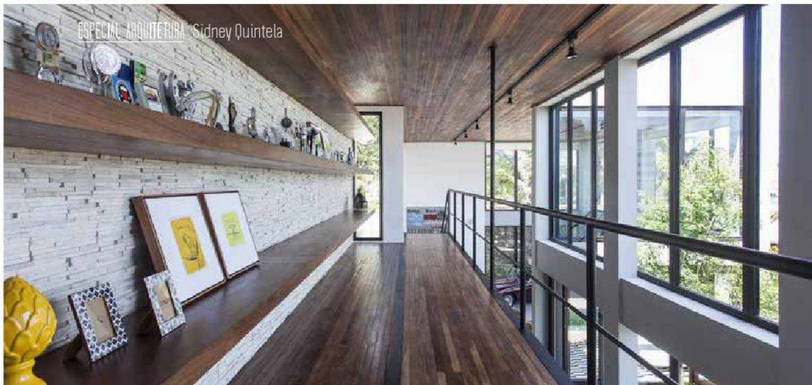
No mezzanino, a estrutura metálica recebeu assoalho, forro e prateleiras de cumaru, da Madeireira Monte Sinai; já a parede foi revestida com canjiquinha de pedras.

Sidney Quintela é um nome de credibilidade quando se fala em arquitetura no Brasil. Conhecido por renomados trabalhos, Sidney nos conta que sua paixão pela arquitetura começou quando ele foi conhecer a Faculdade de Arquitetura da UFBA em 1991 "Fiz um curso de desenho de observação, o que me proporcionou conviver naquele ambiente por 30 dias. Foi exatamente ali que decidi que gostaria de passar os próximos seis anos da minha vida naquele espaço, e no ano seguinte (1992) estava cursando arquitetura e urbanismo na FAU UFBA".