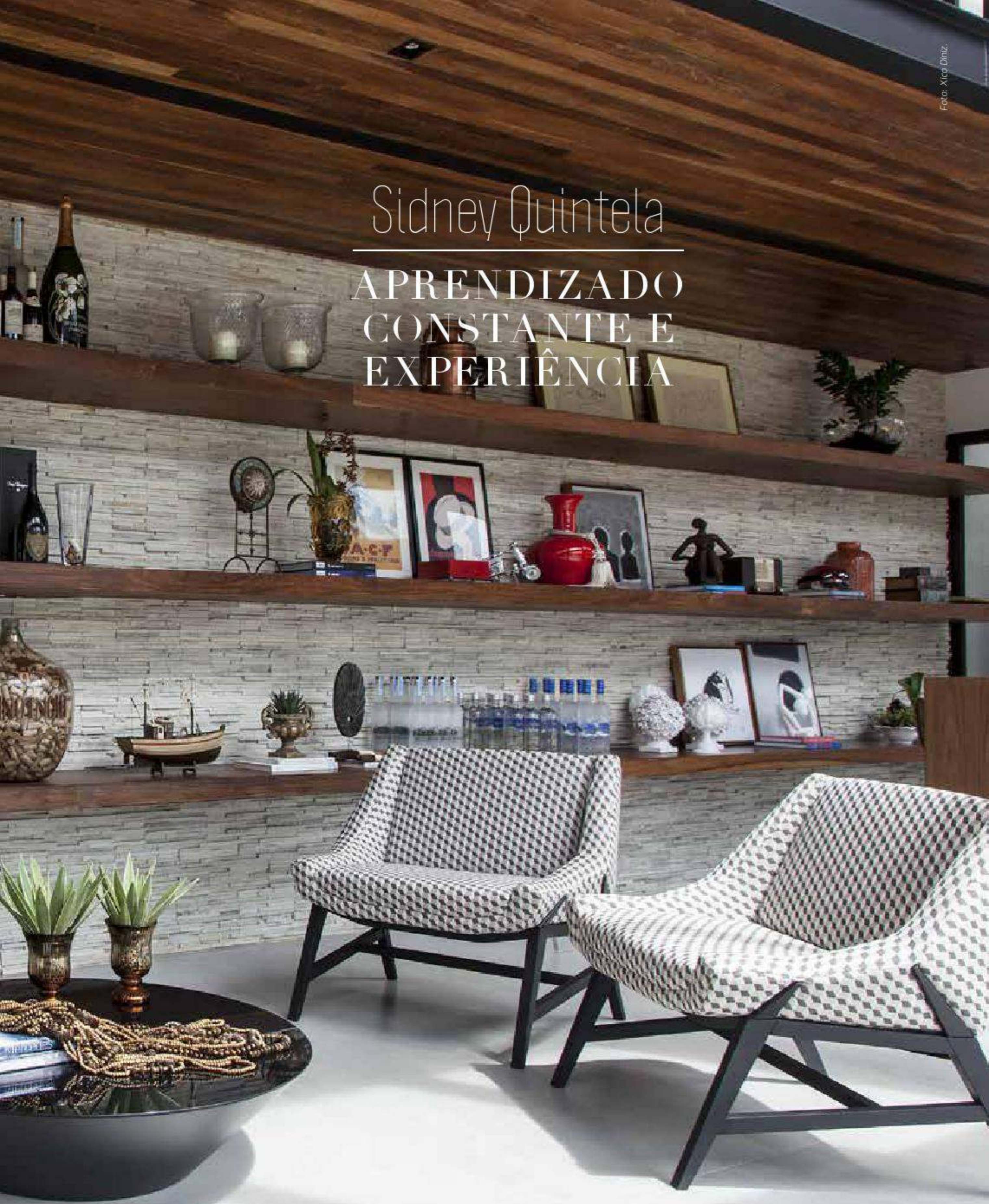
> Além de carros e bicicletas de luxo, o proprietário também coleciona bebidas que são exibidas em prateleiras de cumaru. A parede é revestida com canjiquinha de pedras. No piso, porcelanato Cimento Grigio Biancongrès, da Casa Amorim. Os móveis são da Home Design.